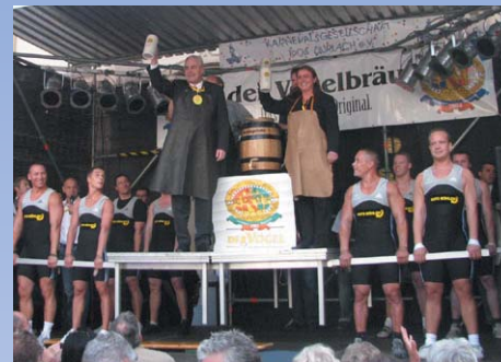
Altstadtfest – Eröffnung Fassanstich

Das am 16. September 1977 anlässlich der Einweihung der Fußgängerzone aus der Taufe gehobene Durlacher Altstadtfest findet jeweils am ersten Juli-Wochenende