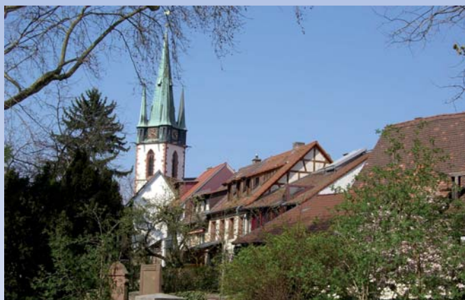
Blick vom Alten Friedhof