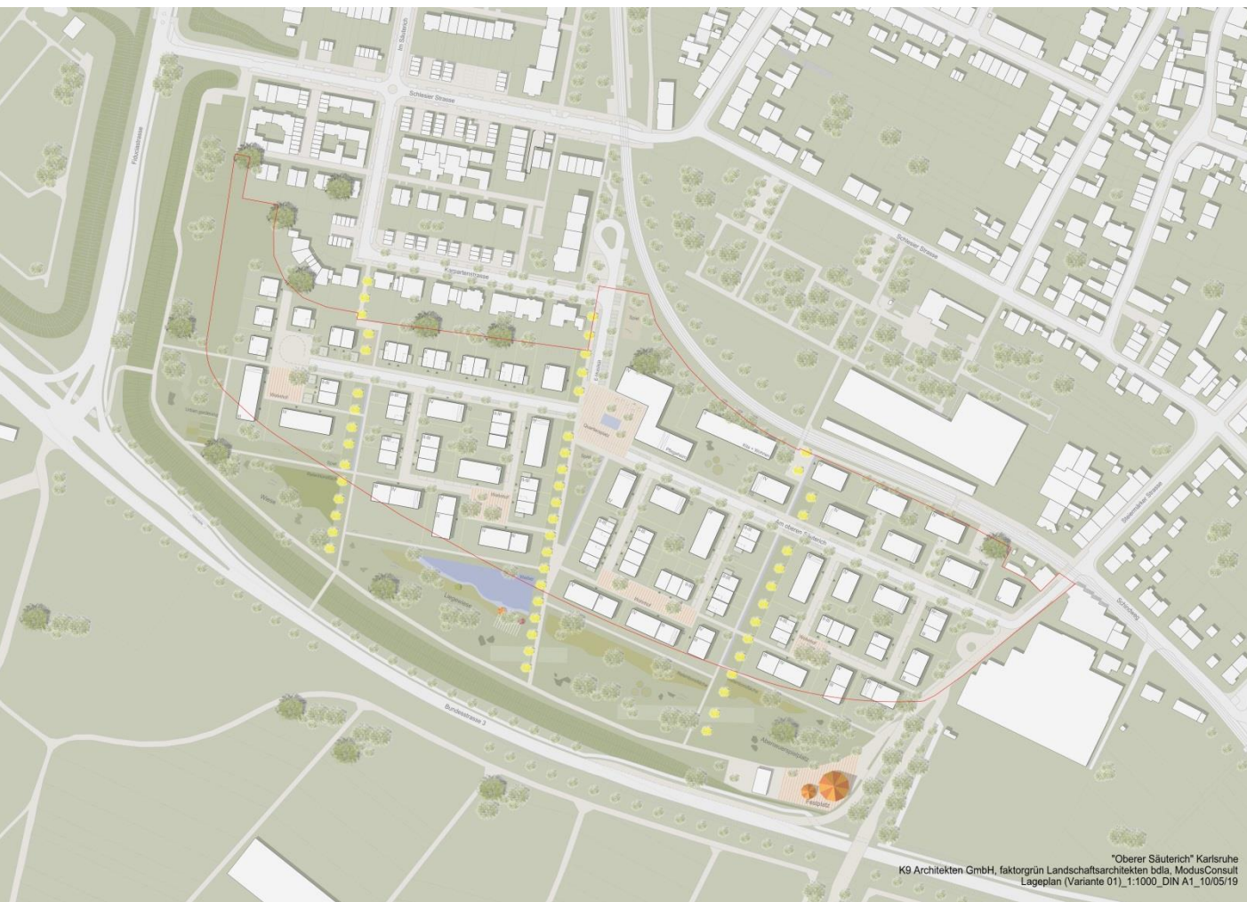
Variante 1: Planung mit Kita und Pflegeheim (ca. 385 WE)