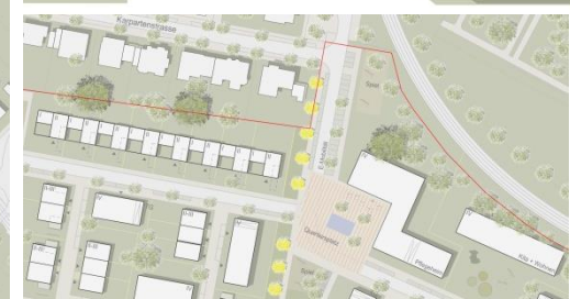
Variante 2: Planung mit Kita und Pflegeheim Reihe mit 8 Winkelhäusern + Aufstockung der Kita (16 WE): 395 WE