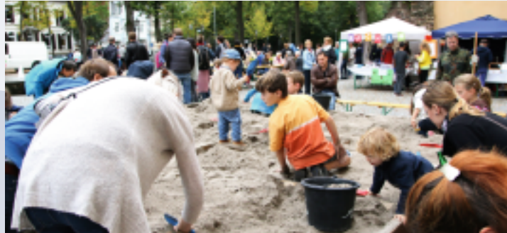
Beliebt: Die große Schatzsuche beim Kindertag.

Ebenfalls spannend geht es am Sonntag, 17. September 2017 , für Kinder in und vor der Karlsburg zu. Das Pfinzgaumuseum beendet die Sommersaison und feiert dies mit seinem Kindertag. Bei freiem Eintritt können Familien zwischen 11 und 18 Uhr auf Schatzsuche gehen, in der Druckerei eigene Karten herstellen und an zahlreichen weiteren Mitmachaktionen teilnehmen. Außerdem werden Führungen angeboten.